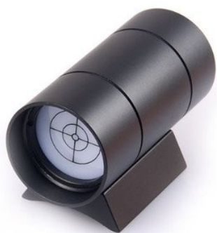
Figure 2 : chercheur solaire AST #57929

difficultés à trouver le soleil, nous proposons des chercheurs solaires spéciaux dans notre gamme de produits.