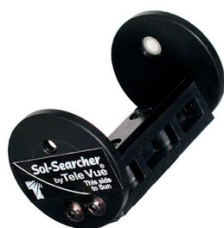
Figure 3 : chercheur solaire TeleVue #14700