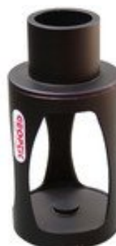
Figure 4 : chercheur solaire Geoptik #44564

3.5 Tournez le tube du télescope hors de l'axe du soleil avant de retirer le filtre de l'objectif à la fin de votre observation.